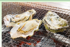
牡蠣小屋

情報交換会費:一般:6,000円 学生:3,000円 2025年1月10日(金)までにHP上で事前登録・決済をお願いします。 情報交換会終了後、大学会館前バス停から西条駅までバスを用意しますが、 人数に限りがございますので、ご留意ください。